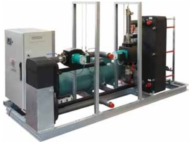
Central de energía "Titan Z" (Ej. Titan Z 230 WW HT)