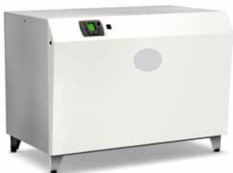
Conergy Titan – hasta 190 kW de serie, con carcasa de aislamiento de ruidos.

Los compresores de tornillo "Tandem" de alta eficiencia garantizan el mejor rendimiento en todas las situaciones de funcionamiento. En potencias a partir de 190 kW la bombas Titan de serie se entregan con bastidores abiertos. Disponen de modernos compresores de tornillo regulables en varios pasos para su empleo con la máxima eficiencia, también en funcionamiento con carga parcial.