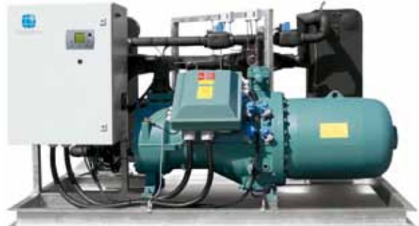
Conergy Titan – hasta 190 kW de serie, con carcasa aislante de ruido.