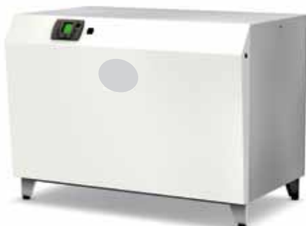
Conergy Titan – hasta 190 kW de serie, con carcasa de aislamiento de ruidos.